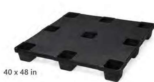
Modelo EXP-1010 Cerrada

Aprobada por Normas Aduaneras Internacionales