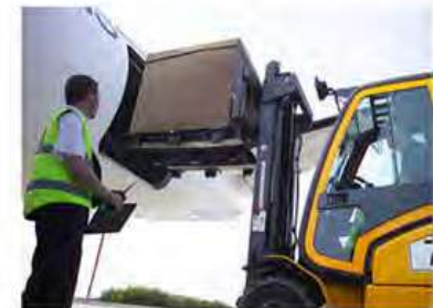
Diseño logístico moderno

Reduce hasta un 80% Costos de Almacenaje y Envío.