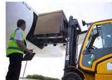
Diseño logístico moderno Patín Hidráulico o Montacargas por los 4 lados.