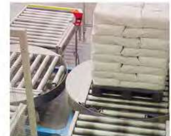
Uso con Patín Hidráulico y Montacargas por los 4 lados