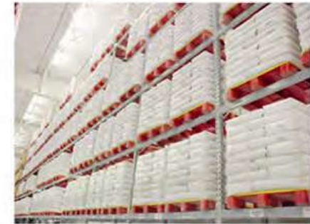
Habilitada para Racks Patín Hidráulico o Montacargas por los 4 lados.