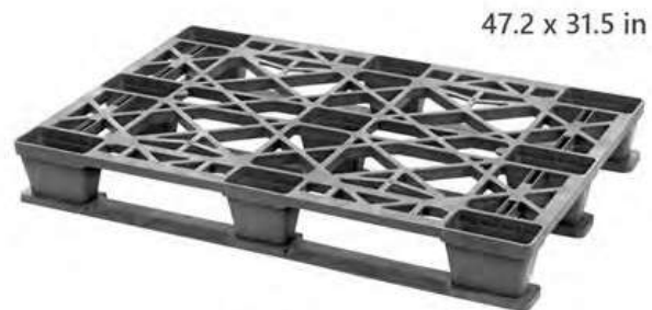
Tarima EuroPallet, 120 x 80 cm Resistente + Bajo Costo + Durabilidad