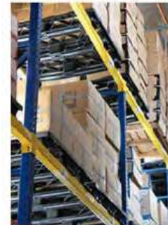
Habilitada para uso en Racks Uso con Patín Hidráulico o Montacargas