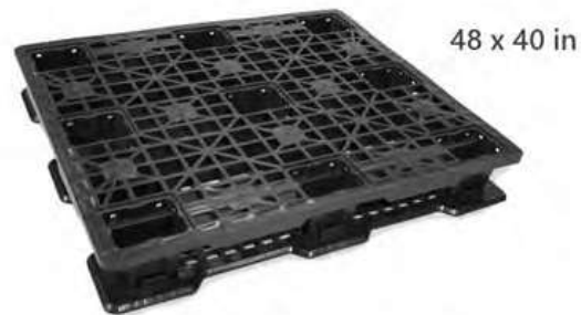
Nuestro Modelo más Vendido Resistente + Bajo Costo + Durabilidad