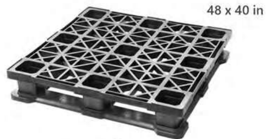
Nuestro Modelo más Vendido Resistente + Bajo Costo + Durabilidad