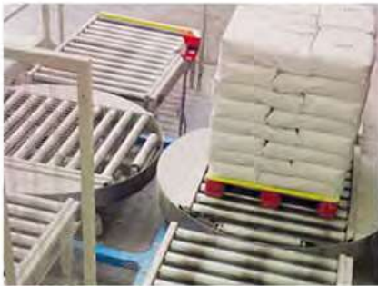
Grado Alimenticio y Farmacéutico Diseñado para Aplicaciones Exigentes