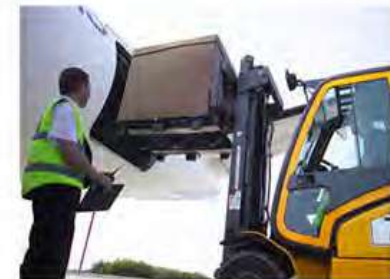
Diseño logístico moderno Patín Hidráulico o Montacargas por los 4 lados.