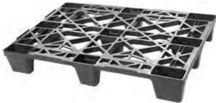
Modelo EuroPallet Aprobada por Normas Aduaneras Internacionales