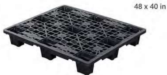
Modelo EXP-1010L Ideal para envíos