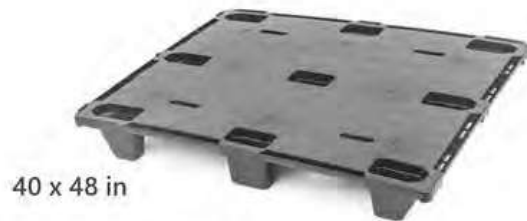
Modelo EXP-1010LC Cerrada

Aprobada por Normas Aduaneras Internacionales