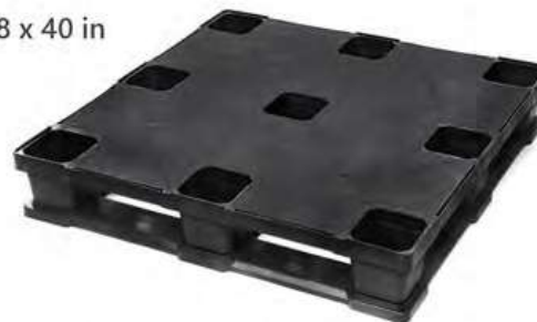
Nuestro Modelo más Vendido Resistente + Bajo Costo + Durabilidad