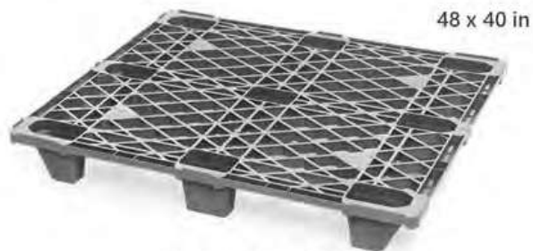
Modelo EXP-1010L Ideal para envíos