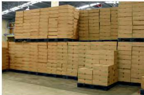
Perfecta para Estibar y Almacenar Productos