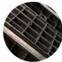
Reforzado con Barras de Acero