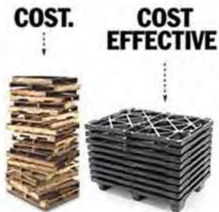
Diseño Anidable Reduce hasta un 80% Costos de Almacenaje y Envío.