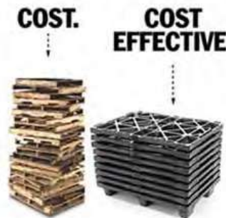
Diseño Anidable Reduce hasta un 80% Costos de Almacenaje y Envío.