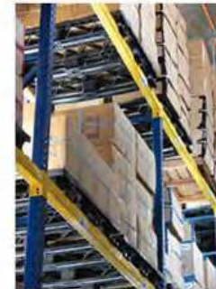
4 WAY Pallet Patín Hidráulico o Montacargas por los 4 lados.