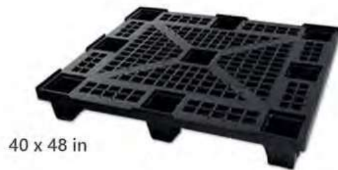
Modelo EXP-1010 Aprobada por Normas Aduaneras Internacionales