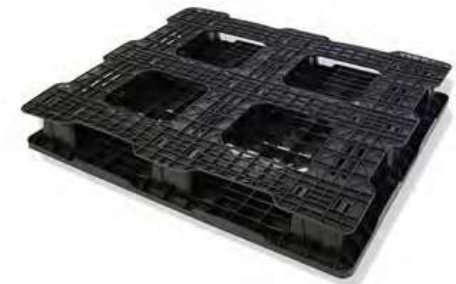
4 WAY Pallet Patín Hidráulico o Montacargas por los 4 lados.