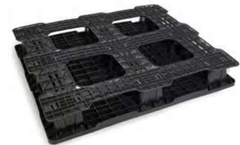
4 WAY Pallet Patín Hidráulico o Montacargas por los 4 lados.