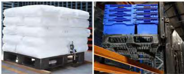
Aplicaciones de Uso Rudo Fabricado con HDPE de alta calidad Habilitada para Racks de Almacenamiento