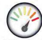
15 Toneladas Capacidad de Carga Estática