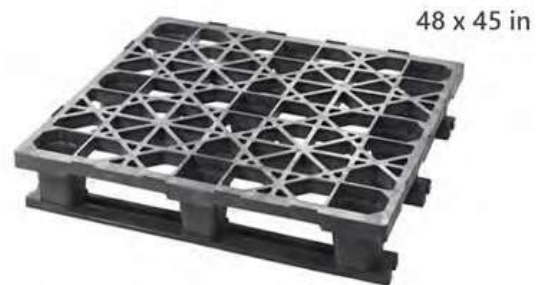
Nuestro Modelo más Vendido Resistente + Bajo Costo + Durabilidad