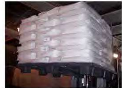
Diseño logístico moderno / 4 WAY Pallet

Reduce hasta un 80% Costos de Almacenaje y Envío.